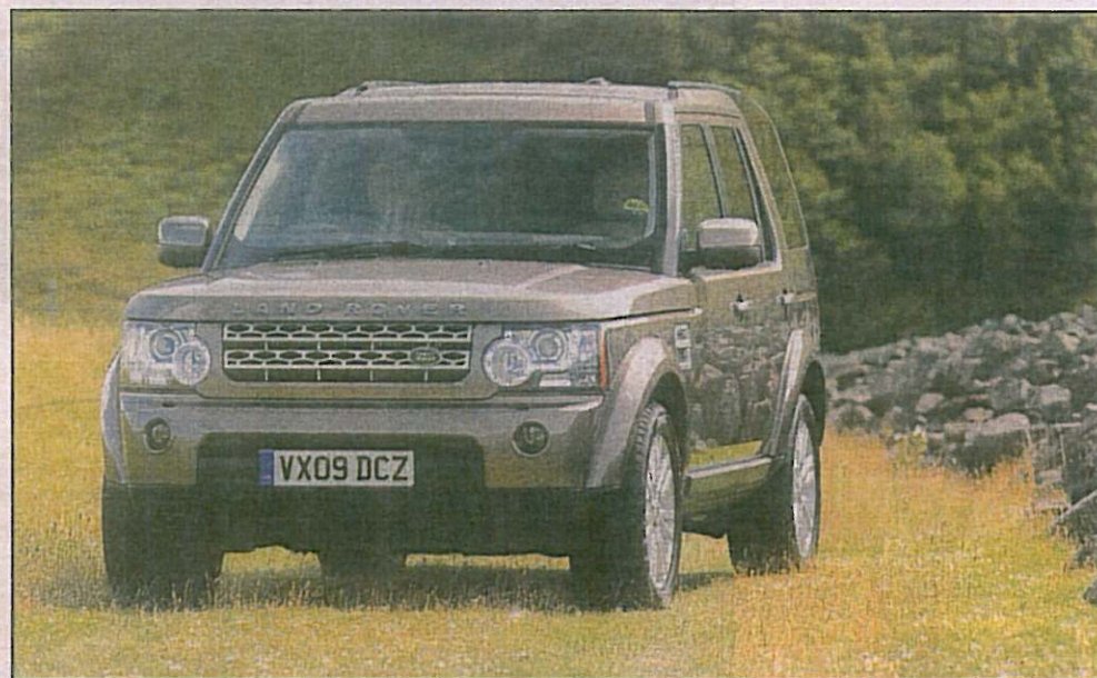
Van voor af lyk die Disco 4 baie soos sy grootboet, die Range Rover.