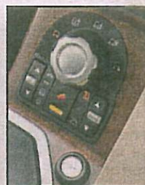
Links: Terrain Response ... Draai die knop na gelang van die oppervlaktoestand (modder, sand, gras of rotse,) kies laestrek en sie daar.